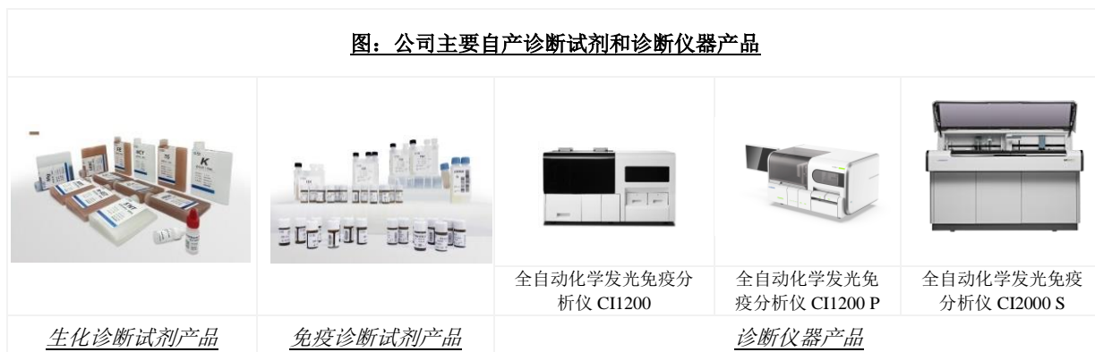
图：公司主要自产诊断试剂和诊断仪器产品

公司在生物化学原料领域产品包括生物酶、辅酶、抗原、抗体、精细化学品等各种试剂，应用范围涵盖生物科技、临床诊断和化工生产等多个方面。公司是国内极少数掌握诊断酶制备技术的诊断试剂生产企业之一。全资子公司阿匹斯通过借助利德曼多年积累的体外诊断行业渠道、国内各级医疗机构以及科研机构资源，可以服务于体外诊断、临床诊断与医疗、生命科学、食品检测等专业领域的企业、大学、科研院所。